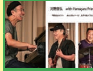
sound office 音旅舎

8日(土) 11:30 / 千草幼稚園 トイピアノ(おもちゃのピアノ) 4台+トイ打楽器(おもちゃの木琴・鉄琴・ドラム) おもちゃ楽器のアンプサンプルあり! お菓子をあげクイズあり! 歌遊びコーナーあり! 「小さな楽器による」「小さな子どもたちのための」小さな小さなコンサートです。